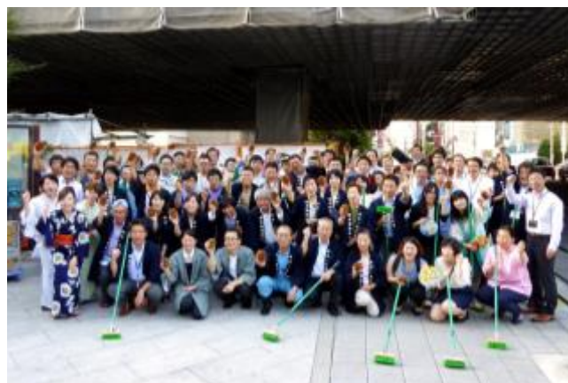
「鎌倉橋橋洗い」昨年の様子