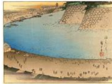
江戸期の鎌倉河岸