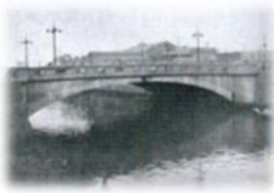
鎌倉橋 昭和4年(1929)4月25日

鎌倉橋は、昭和4年(1929年)4月25日に、関東大震災の復興橋のひとつとして大手町一・二丁目から内神田一・二丁目に通じて、日本橋川に架橋。長さは30.1m、幅22mのコンクリート製となります。昭和19年(1944年)11月の米軍による日本本土市街地への爆撃と機銃掃射の銃弾の跡が大小30個ほどあり、戦争の恐ろしさを今に伝えています。