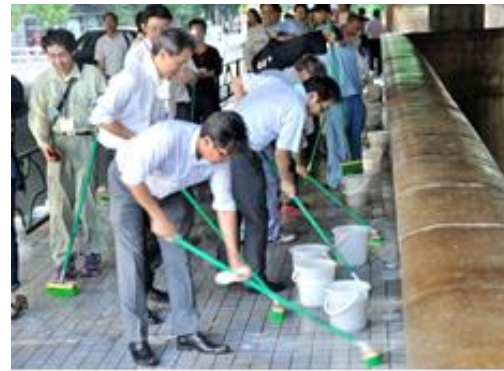
「鎌倉橋橋洗い」昨年の様子