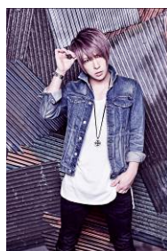
歌広場淳 (ゴールデンボンバー)