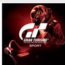
『グランツーリスモSPORT』