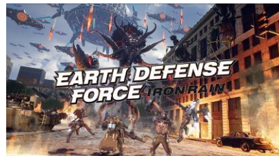
『EARTH DEFENSE FORCE: IRON RAIN』