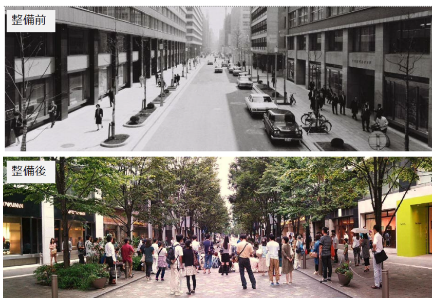
丸の内仲通りの比較（整備前・整備後）