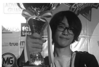
えいた (有名ゲーマー)