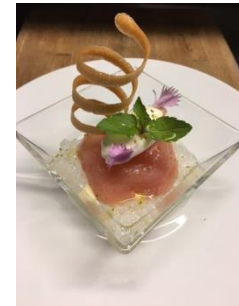
さあ今日は君がパティシエさっ！！ 季節のデザートをレッツ・チャレンジ！ 8月8日（月）・9日（火）・10日（水） ※写真はイメージです。