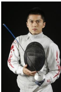
フェンシングに初チャレンジ！ みんなで体験してみよう！ 8月13日（土）