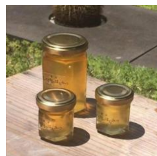
東京丸の内のはちみつ