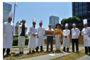
採蜜作業会の様子

丸の内ハニープロジェクト実行委員会を組成し、地域の活動として大丸有地区のコミュニティ形成に貢献。