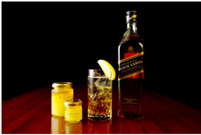
ハニーハイボール