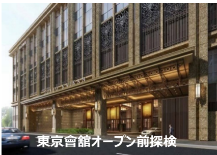
東京會館オープン前探検