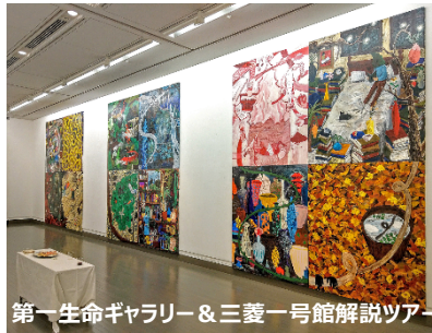
第一生命ギャラリー &amp; 三菱一号館解説ツアー