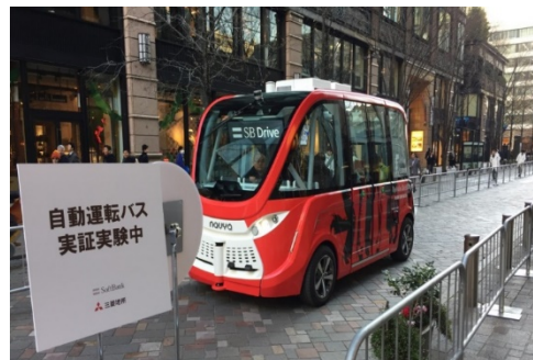
丸の内仲通り(公道)での自動運転バスの走行実験