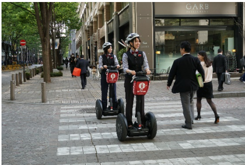
丸の内仲通り(公道)での「セグウェイ」の走行実証実験