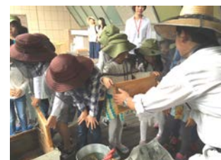
エコキッズ探検隊

丸の内仲通り、行幸通り、丸ビル周辺で開催される「東京丸の内盆踊り 2016」にて養蜂活動の様子やラベユで販売されている蜂蜜の紹介の他、この蜂蜜を使用した「丸の内ハニーハイボール」を(株)コットンクラブジャパンと共同で限定販売。