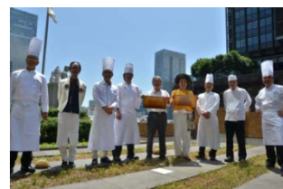
採蜜作業会の様子

丸ビル地下1階の「はちみつ専門店 ラベユ（*2）」にて「東京丸の内のはちみつ」の販売を8月7日より開始。（*2）現在は新丸ビル地下1階に移転