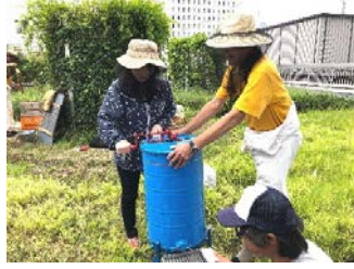
⑤ 遠心分離機を回転させる