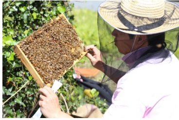
① 巣箱から巣枠を取り出す作業