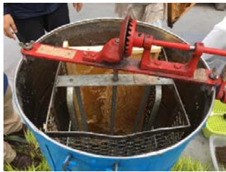
④ 遠心分離機内に巣枠をセット