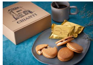
ケーキおしまるや ～丸の内ハニーのパウンドケーキ～