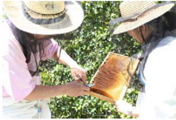
② 巣枠からミツバチを離し糖度を測る