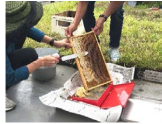
③ 巣枠の「蜜ヅタ」を切り落とす作業