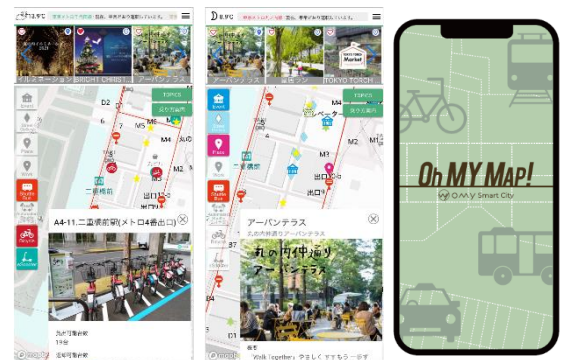
前回提供時イメージ