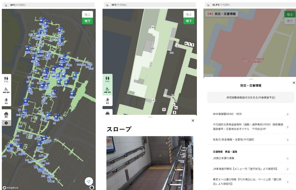
アプリ画面イメージ

※災害ダッシュボードとは：三菱地所が実証実験を進める、災害対策機関での情報共有や帰宅困難者向けの情報ハブ機能（最新のリリース（2022年2月15日） https://www.mec.co.jp/j/news/archives/mec220215_saigaidashboard.pdf ）