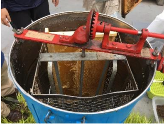
④ 遠心分離機内に巣枠をセット