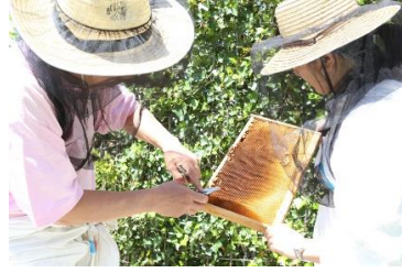
② 巣枠からミツバチを離し糖度を測る