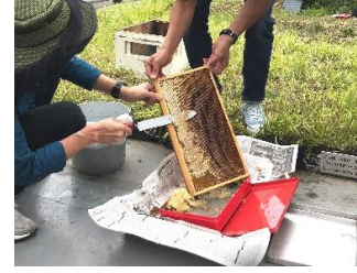
③ 巣枠の「蜜ブタ」を切り落とす作業