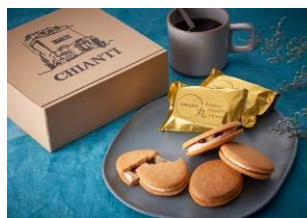
ケーキおしまるや ～丸の内ハニーのパウンドケーキ～

1,296円（税込） 丸の内ハニー本来の味わいを堪能できるよう、余計な食材を加えずに焼いた香り豊かなパウンドケーキ