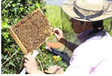
① 巣箱から巣枠を取り出す作業