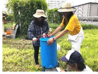
⑤ 遠心分離機を回転させる