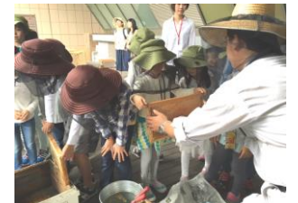
エコキッズ探検隊

丸の内ハニープロジェクト実行委員会を組成し、地域の活動として大丸有地区のコミュニティ形成に貢献。