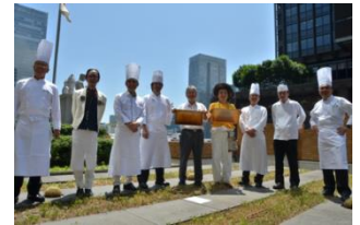
採蜜作業会の様子

丸ビル地下1階の「はちみつ専門店 ラベイユ（*2）」にて「東京丸の内のはちみつ」の販売を8月7日より開始。（*2）現在は新丸ビル地下1階に移転