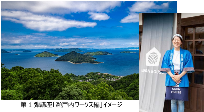
第1弾講座「瀬戸内ワークス編」イメージ

大手町・丸の内・有楽町地区街づくり3団体(*)の一般社団法人 大丸有環境共生型まちづくり推進協会(以下、エコツェリア協会)は、丸の内朝大学の新たな試みとして『丸の内』と『外』で自由に働く人を応援する「丸の内朝大学 ニッポン就職課」を設立し、第1弾講座として「瀬戸内ワークス編」を4月23日（火）よりスタートいたします。