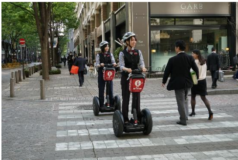
丸の内仲通り(公道)での「セグウェイ」の走行実証実験