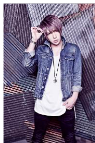
歌広場 淳 (ゴールデンボンバー)