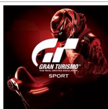
『グランツーリスモSPORT』