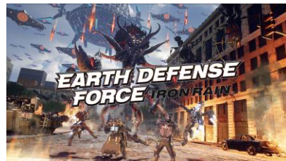
『EARTH DEFENSE FORCE: IRON RAIN』