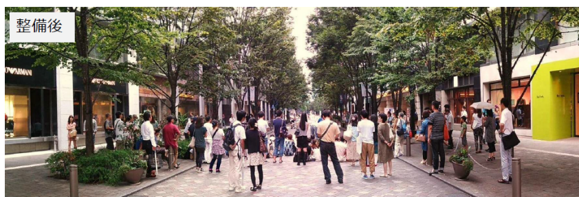
丸の内仲通りの比較（整備前・整備後）