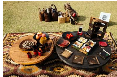
丸の内工芸園遊会