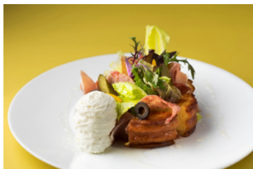
東京ステーションホテル ロビーラウンジ オリジナルフレンチトースト(エビス)