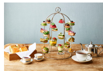
※実際はボックスでのご提供となります。