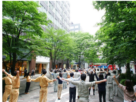
例年実施時の様子

大手町・丸の内・有楽町地区街づくり3団体(*)の大丸有エリアマネジメント協会（以下、リガーレ）では、丸の内仲通りにて、ランチタイム後のリフレッシュを目的に「 第8回丸の内ラジオ体操 」を実施いたします。