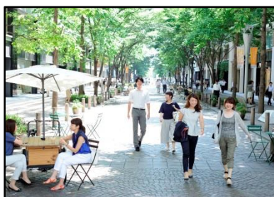
自由に利用可能な イスや机等を日中設置しています

丸の内仲通りの日常的な環境創出（自由に使えるイスやテーブル等の設置、キッチンカーの出店）を行うとともに各種イベントやアクティビティの受け入れを行っています。 ※キッチンカーによる出店は現在休止中です。