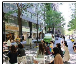
企業商材のPRイベントや ワークショップ等受け入れ