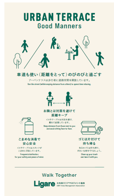
アーバンテラス グッドマナー