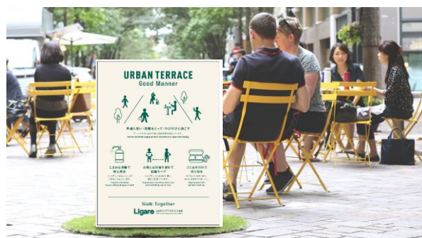
アーバンテラス グッドマナー実施イメージ