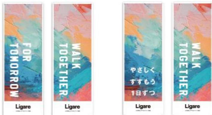
メッセージフラッグ デザイン

アーバンテラス再開にあたり、徐々に戻っている丸の内周辺オフィス・飲食店で勤務されている方々、現在も厳しい環境の中活躍されている医療関係従事者の皆さまに向けて、「みんなでこの危機を乗り越えよう」というメッセージを込めて「Walk Together」をテーマにメッセージフラッグを各場所に設置いたします。