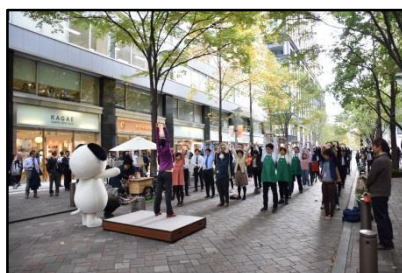
ワーカーの健康を促進する エリア活動を実施