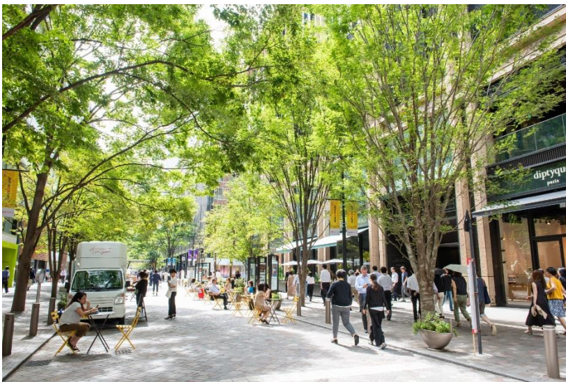
丸の内仲通りアーバンテラスの様子