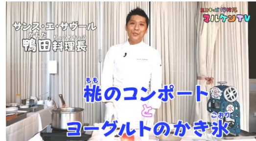
ひんやりデザートを作って暑さを乗り切ろう！ 丸の内シェフズクラブ編