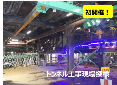
トンネル工事現場探検