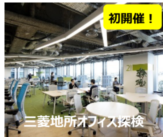
三菱地所オフィス探検