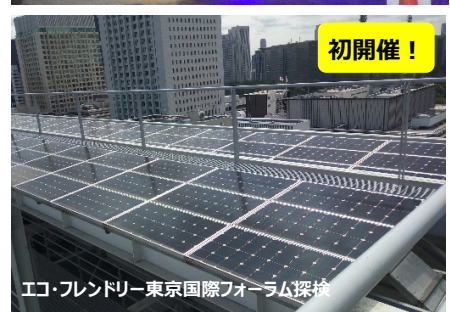
エコ・フレンドリー東京国際フォーラム探検