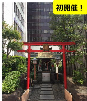
御利益とフチ歴史探訪ツアー