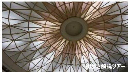
樹木医解説ツアー