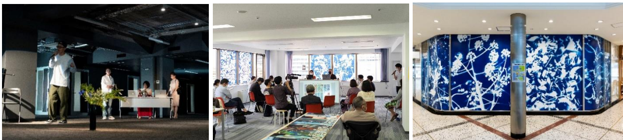
「第1期開催時の様子」

大手町・丸の内・有楽町エリア(以下、大丸有エリア)では、ビジネス街における「アートアーバニズム」を実践し、アーティストとワーカー・企業の交流を促進することで、都市のマインドを変え創造と革新を起こしていく先導的な取り組みを今後も進めてまいります。