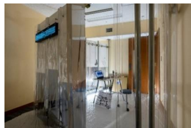
「第1期開催時の様子」