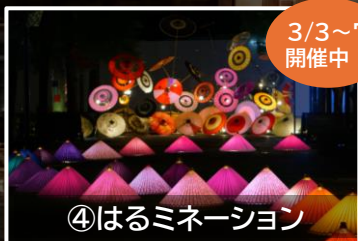
④はるミネーション