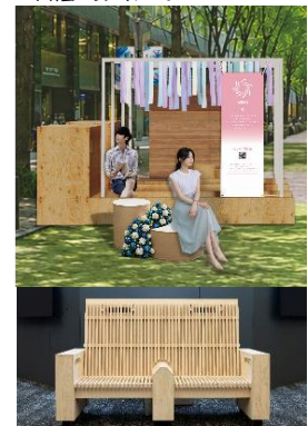
▲（上）風エリアイメージ （下）空調機能付きベンチ