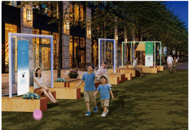
▲Block3 (明治安田生命ビル・三菱一号館美術館・丸の内パークビル前) 展開イメージ・夜