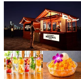
▲(上)Marunouchi Mocktail Stand (下)提供メニュー※一例