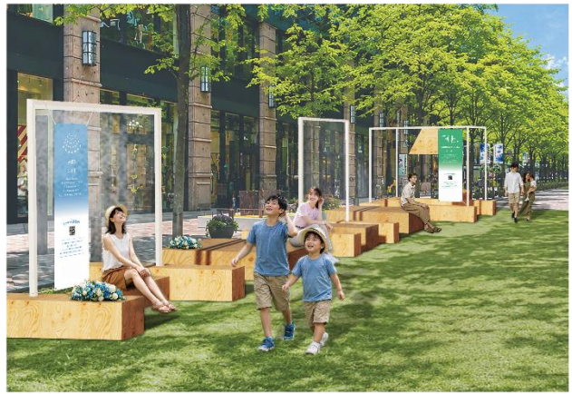
▲Block3（明治安田生命ビル・三菱一号館美術館・丸の内パークビル前）展開イメージ・昼