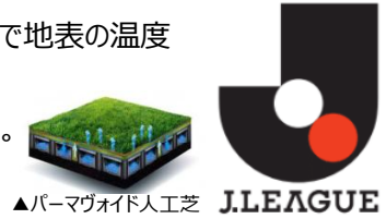
▲パーマヴォイド人工芝 J.LEAGUE