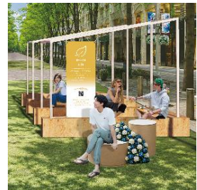
▲日陰エリアイメージ