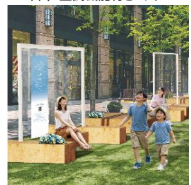
▲ミストエリアイメージ