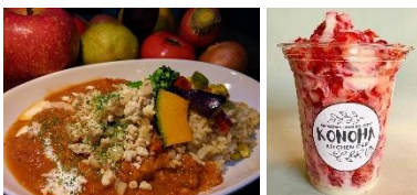
▲出店メニュー一例