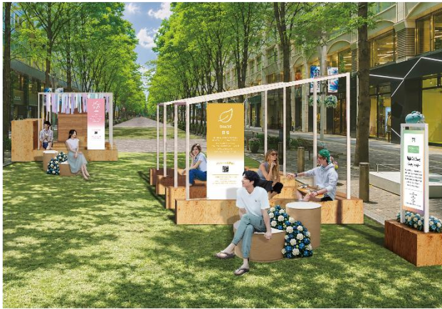
▲Block2（丸の内仲通りビル・丸の内二丁目ビル前）展開イメージ・昼

11社の共創企業と連携し、涼しさを五感で体感できるエリアを設置します。 芝生は遮熱・断熱技術を採用した人工芝を使用することにより、通常の人工芝と比較して、表面温度を約10℃抑え、夏場でも快適な空間を提供します。