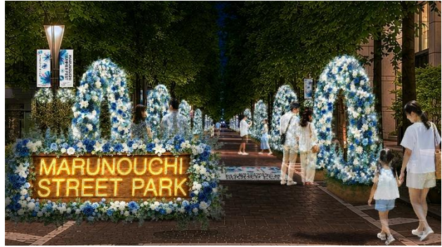
▲Block1（三菱商事ビル・郵船ビル・丸ビル前）展開イメージ・夜