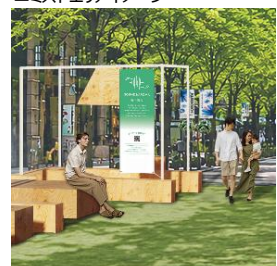
▲音・香りエリアイメージ