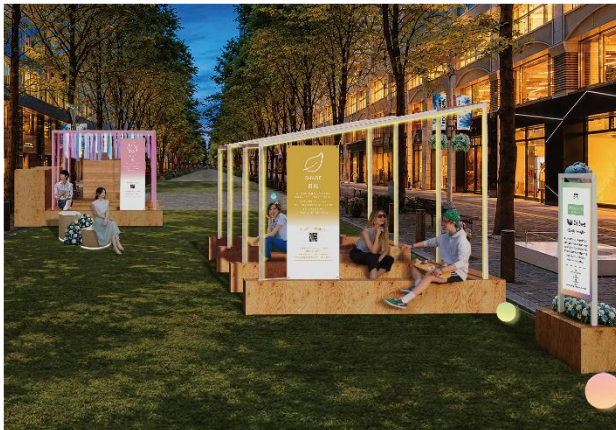
▲Block2 (丸の内仲通りビル・丸の内二丁目ビル前) 展開イメージ・夜

各什器をネオンで彩り、丸の内仲通りを就業者や来街者が集い、飲食や会話を楽しめる「夜の遊び場」へと変化します。光る遊具の貸出や飲食スペースの設置により昼とは異なる滞在価値を提供し、終業後や飲み会前にも気軽に立ち寄れるナイトタイム空間を創出します。さらに、音楽とともにくつろげる空間に加え、ヨガやカラダづくりなど酷暑対策のプログラムも展開し、ネオン演出とともに丸の内の夏の夜を五感で楽しめます。