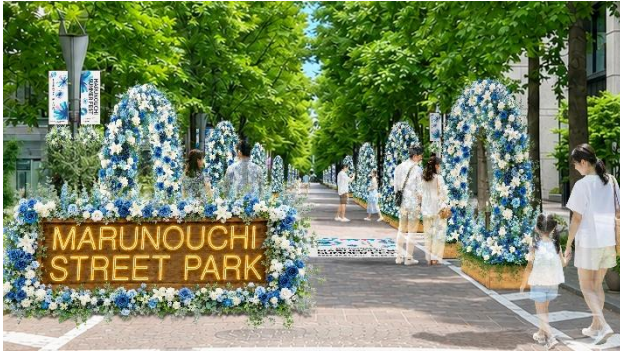
▲Block1（三菱商事ビル・郵船ビル・丸ビル前）展開イメージ・昼