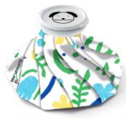
▲オリジナル氷のう